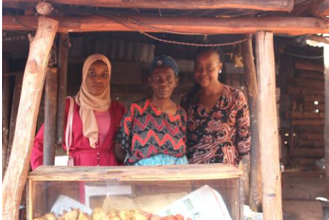
Hope op huisbezoek om te kijken hoe het gaat.