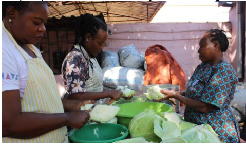
Verzorgsters helpen koks met snijden van kool.