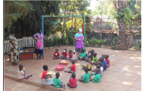
Katy uit Dayton OH, terug om te helpen.