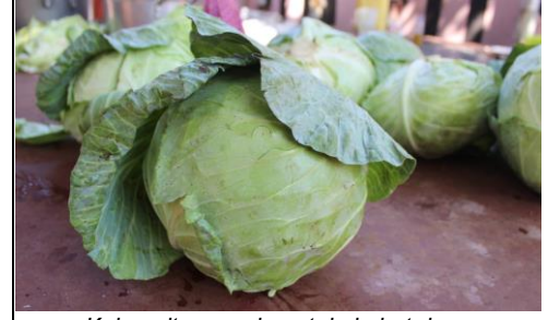
Kolen uit onze eigen tuin in het dorp.