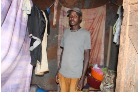
Huisbezoek door Hope, maatschappelijk werk