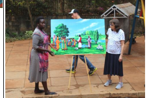
Een mooi doek gekregen.