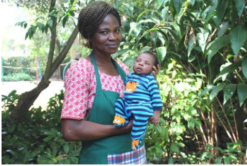
Wilberforce: moeder overleden, krijgt onze hulp.