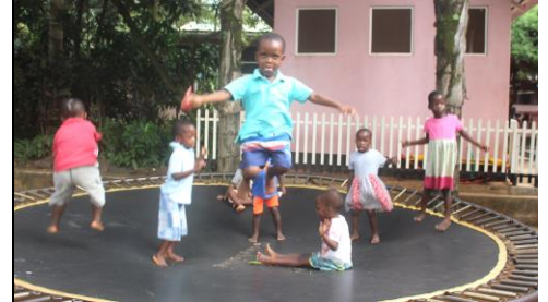
Kijks eens ik kan vliegen