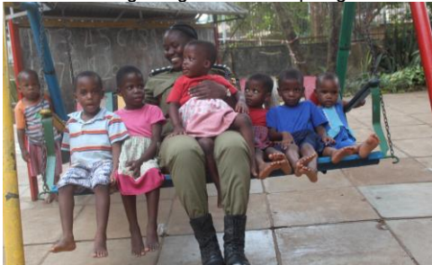
Mumma Police komt soms op bezoek.